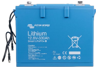
Batterie LiFePO4 12,8 V 330 Ah