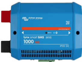
Lynx Smart BMS NG 1 000 A