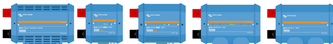
Produits de distribution Lynx avec barres omnibus M10